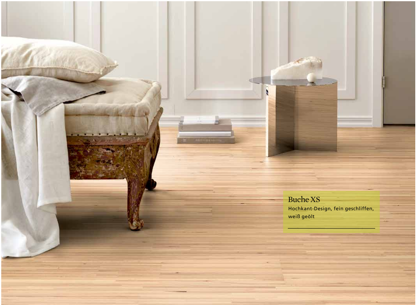
Buche XS Hochkant-Design, fein geschliffen, weiß geölt